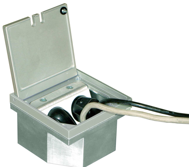
Otwarta puszka 3295.