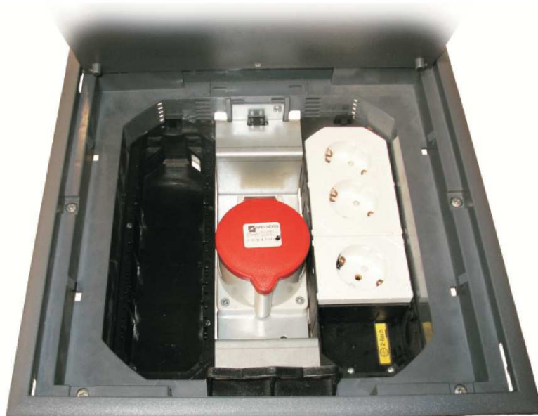
Zamontowane gniazdo CEE w pokrywie Q3 - widok z góry.