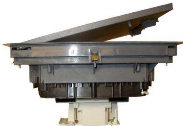
Pokrywa Q3 z gniazdem CEE – widok z boku.