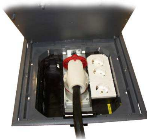
Gniazdo CEE z podłączoną wtyczką.