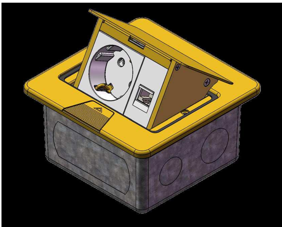
Widok otwartej puszki BSD z dekielkiem uchylnym.